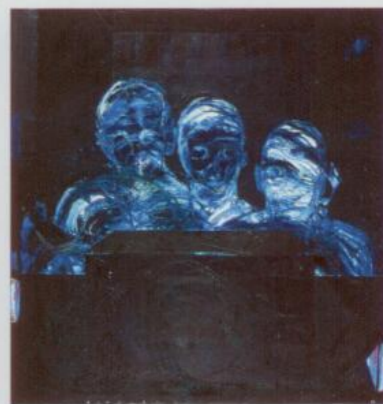
J. Glassey, Sans titre, 1999, 100 x 100 cm.

Bien qu'explorant des chemins fort différents, Jacques Glassey (acquisition en 2001) et Janine Devayes (acquisition en 2003) font entrer dans la collection la figure humaine. Avec Jacques Glassey, cette dernière est engluée, non sans un certain humour, dans la réalité de la vie contemporaine alors que Janine Devayes la libère dans un monde sans pesanteur.