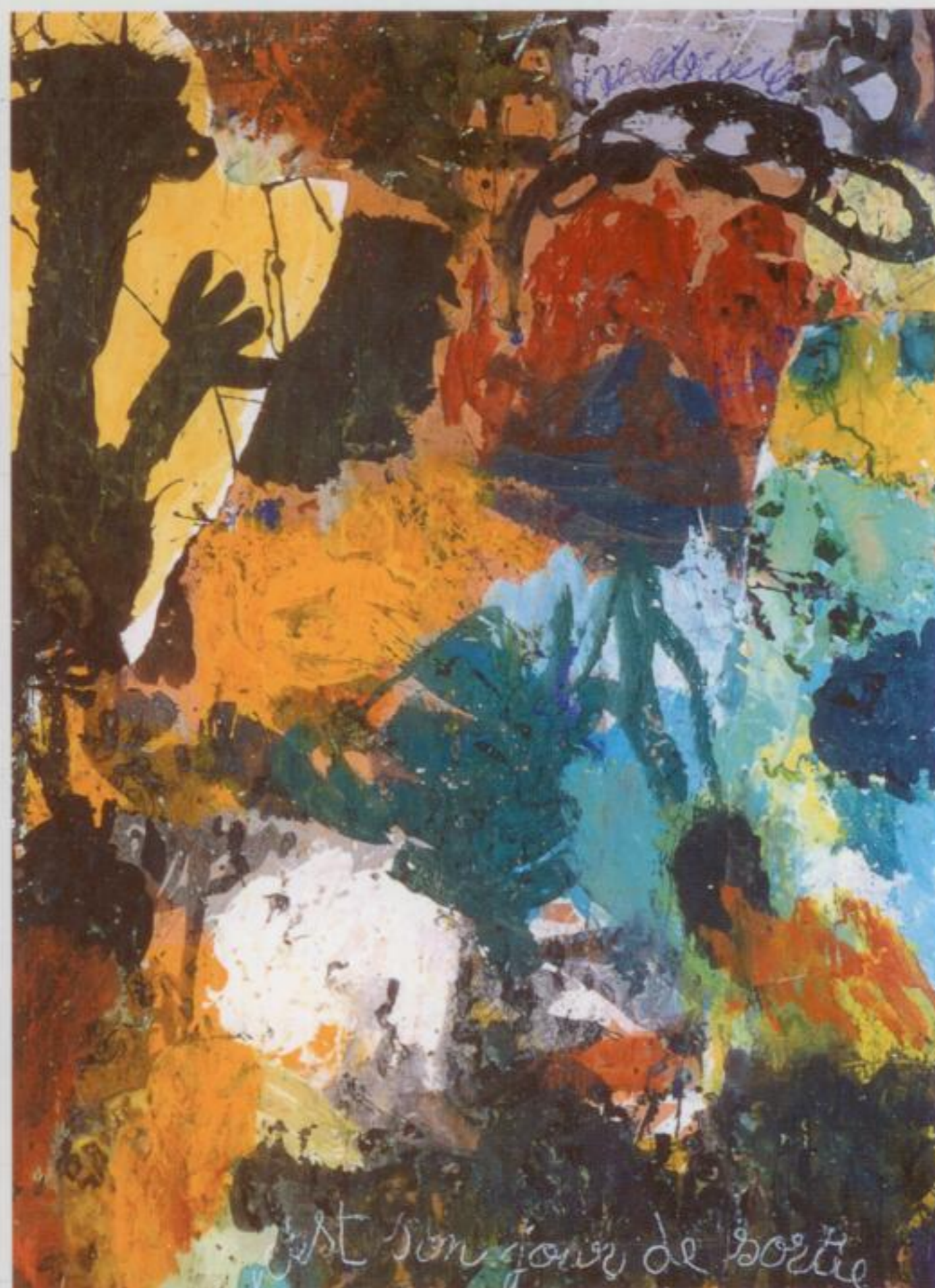
S. Auber, «c'est son jour de sortie», 1999, 190 x 142 cm.

Conçue comme le reflet du climat de création picturale en Valais durant les vingt-cinq dernières années du XX e siècle, la Collection «NF 2000» n'avait pas de raison apparente de survivre au passage du nouveau millénaire. Sa dénomination elle-même contenait déjà la date, l'année 2000, comme l'aboutissement de cette véritable gageure: avoir su ou pu réunir un ensemble représentatif de tableaux dans le contexte autant complexe qu'éclectique voire chaotique de la création en Valais durant le dernier quart du XX e siècle. Pourtant, la présentation de la majeure partie des