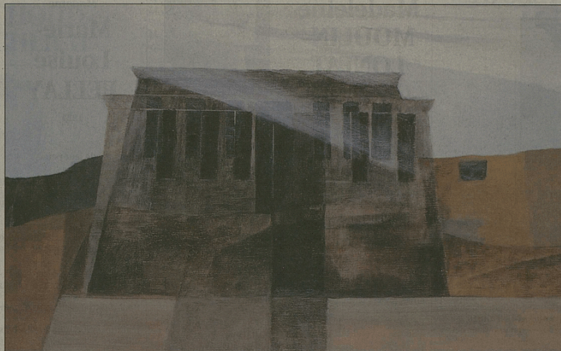
«Temple noir», acryl sur toile, 1986.