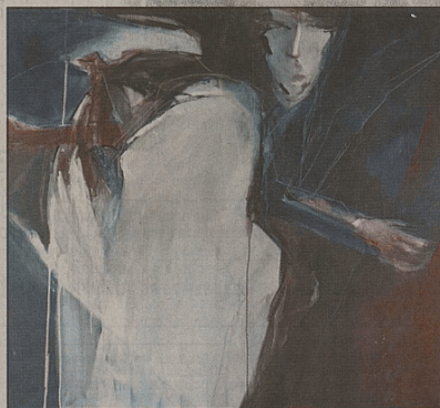
«Bozen» de Denise Eyer-Oggier.

Vingt-cinq œuvres ont ainsi été acquises cette année pour la collection NF 2000 auprès de quinze peintres dont huit sont des femmes. VINCENT PELLEGRINI