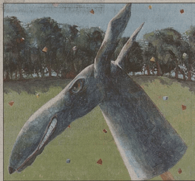
«Y a quelqu'un XIV» de Dominique Studer.