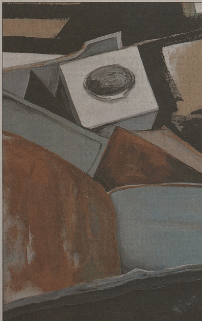
«Démolition», par Anic Cardì.