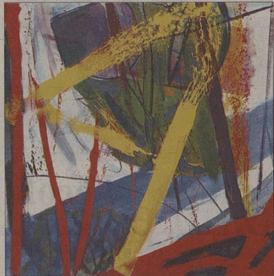
Acryl sur toile de François Pont.